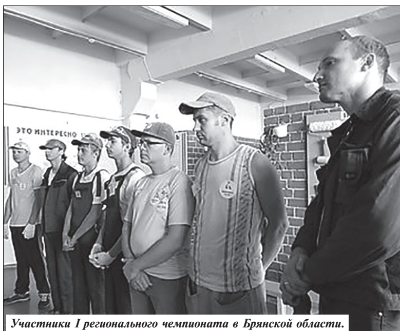
Участники I регионального чемпионата в Брянской области.