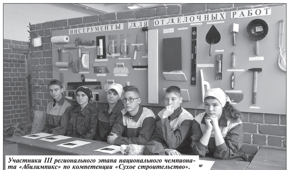
Участники III регионального этапа национального чемпионата «Абилимпикс» по компетенции «Сухое строительство».