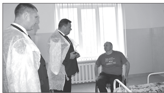
В Новозыбкове открылось паллиативное отделение.

Отделение включает в себя палаты, сестринскую, столовую, процедурную, санузел. Оно предназначено для лечения тяжелобольных людей. Рассчитано на 10 пациентов, сейчас лечатся восемь. Пациенты довольны — здесь как в санатории.