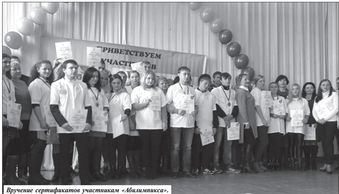
Вручение сертификатов участникам «Абилимпикса».

требованность в выпускниках техникума, естественно, возрастает. Им легче будет трудоустроиться.