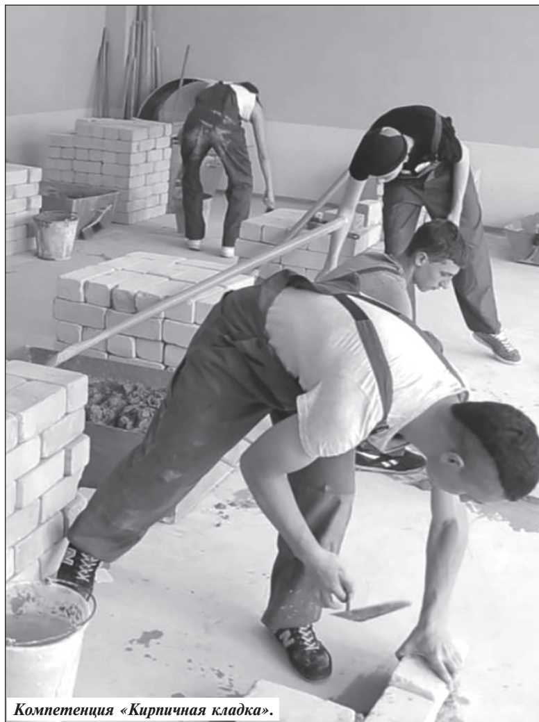
Компетенция «Кирпичная кладка».